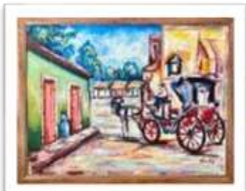
OBR-008508 AUTOR: UBALDO D. RD$4,500.00