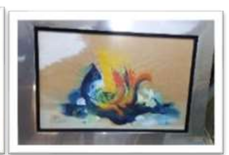
OBR-000008 AUTOR: CAROLINA CEPEDA RD$25,000.00