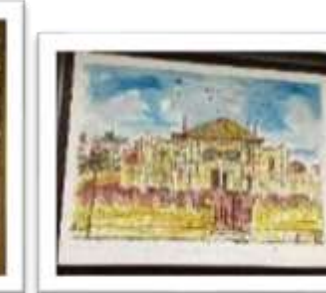
OBR-000048 AUTOR: JUAN CESTERO RD$25,000.00