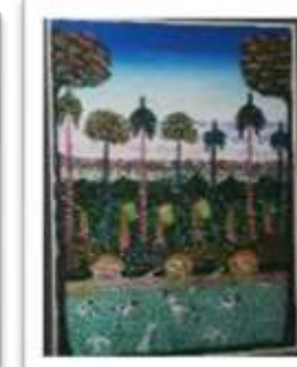
OBR-00085 AUTOR: JUSTO SUSANA RD$75,000.00