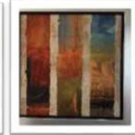
MYE-016322 AUTOR NO IDENTIFICADO RD$2,000.00