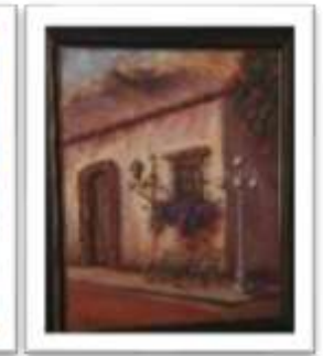
OBR-00105 AUTOR: BOLIVAR Q. RD$11,000.00