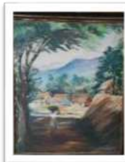
OBR-000173 AUTOR: CARLOS M. GRULLON RD$18,000.00