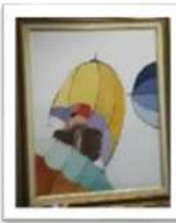
OBR-000022 AUTOR: CLAUDIO P. RD$10,000.00