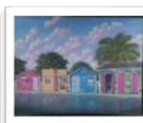
OBR-013524 AUTOR: RAFAEL SANTIAGO RD$20,000.00