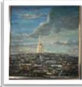
OBR-011809 AUTOR: VICTOR CHEVALIER RD$25,000.00