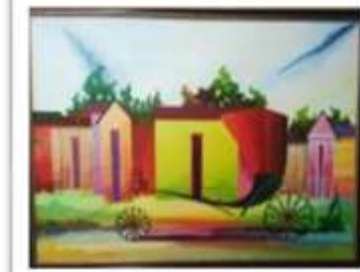
OBR-000168 AUTOR: MIGUEL DOMINGUEZ RD$18,000.00