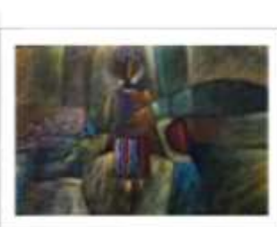
OBR-012992 AUTOR: JUAN BRAVO RD$15,000.00