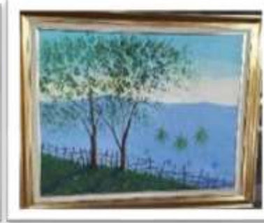
OBR-000004 AUTOR: EUSEBIO VIDAL RD$7,000.00