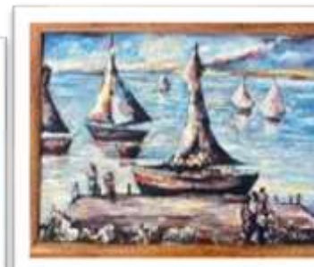
OBR-008510 AUTOR: UBALDO DOMINGUEZ RD$4,500.00