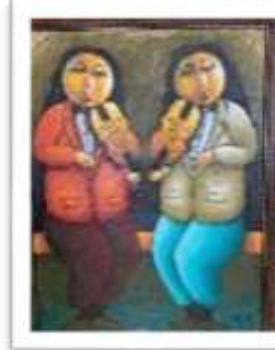
OBR-000163 AUTOR: RAFAEL MARTINEZ RD$7,500.00