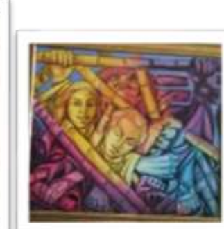
OBR-00086 AUTOR: JUSTO SUSANA RD$229,000.00