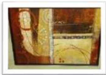
MYE-016325 AUTOR NO IDENTIFICADO RD$2,000.00