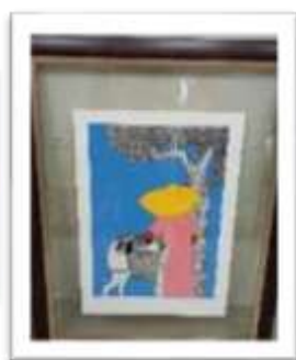
MYE-009897 AUTOR: LUIS AMOR RD$10,000.00