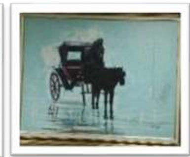
OBR-000019 AUTOR: JUAN EDUARDO RD$40,000.00