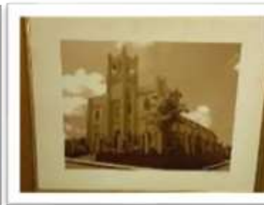
MYE-009621 AUTOR: CESAR PAYAMPS RD$5,000.00