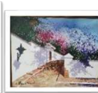
OBR-007945 AUTOR: LUIS OVIEDO RD$17,500.00