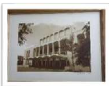
MYE-009545 AUTOR: CESAR PAYAMPS RD$5,000.00