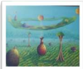
OBR-010764 AUTOR: HECTOR REYNOSO RD$10,000.00