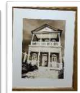
MYE-009543 AUTOR: CESAR PAYAMPS RD$5,000.00