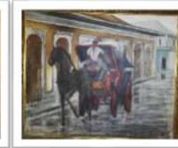
OBR-000047 AUTOR: CARLOS M. GRULLON RD$20,000.00