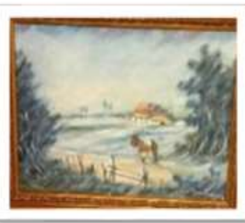
OBR-000002 AUTOR: JUAN RODRIGUEZ RD$50,000.00