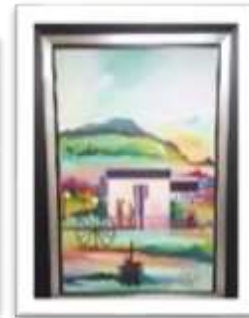
OBR-000161 AUTOR: MIGUEL DGEZ RD$18,000.00