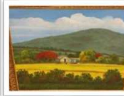
OBR-000199 AUTOR: EDUARDO RODRIGUEZ RD$15,000.00