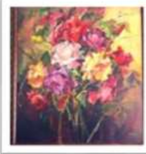
OBR-000191 AUTOR: IVETTE EGA RD$90,000.00