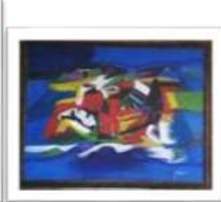
OBR-000140 AUTOR: PABLO PALASSO RD$25,000.00