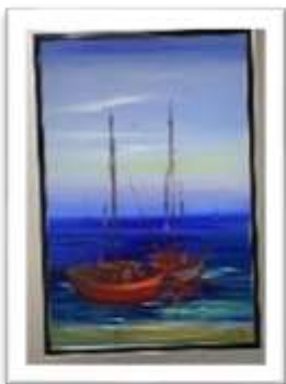
OBR-000190 AUTOR: WILLY PEREZ RD$37,500.00