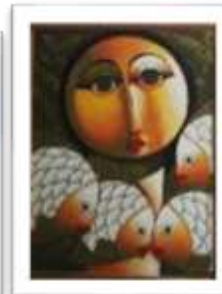
OBR-00092 AUTOR: RAFAEL M. RD$7,500.00