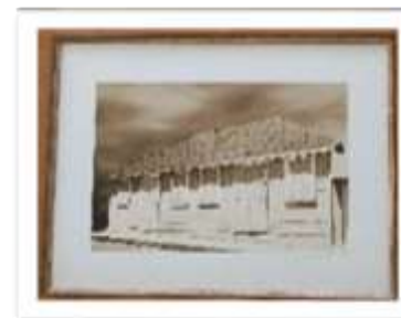
MYE-009620 AUTOR: CESAR PAYAMPS RD$5,000.00