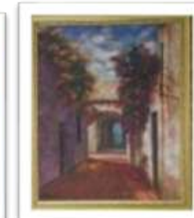
OBR-008121 AUTOR: BOLIVAR QUIÑONES RD$14,500.00