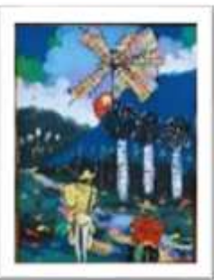
OBR-007888 AUTOR: CLAUDIO P. RD$16,000.00