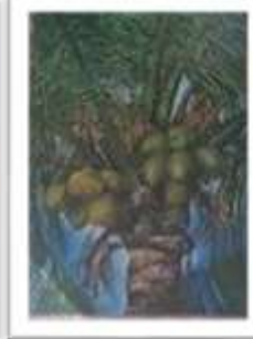
OBR-000192 AUTOR: IVETTE EGA RD$95,000.00