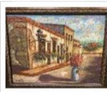
OBR-007952 AUTOR: BOLIVAR QUIÑONES RD$18,000.00