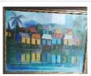
OBR-000154 AUTOR: WILLY PEREZ RD$30,000.00