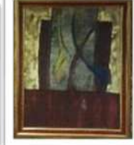
OBR-000067 AUTOR: LUZ SEVERINO RD$275,000.00