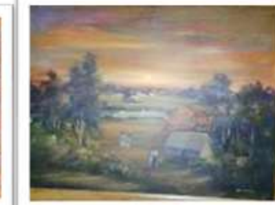
OBR-008512 AUTOR: + A CRUZ RD$6,000.00