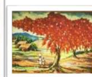
OBR-008515 AUTOR: UBALDO DOMINGUEZ RD$4,500.00