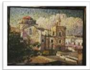
OBR-000135 AUTOR: WILLIAM POUERIET RD$18,000.00