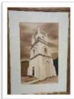
MYE-009624 AUTOR: CESAR PAYAMPS RD$5,000.00