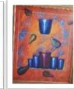
OBR-000139 AUTOR: BERNARDO T. RD$30,000.00