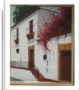
OBR-002283 AUTOR: LUIS OVIEDO RD$12,500.00