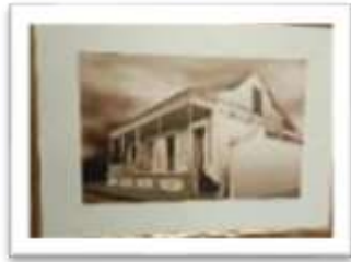
MYE-014983 AUTOR: CESAR PAYAMPS RD$5,000.00