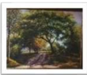
OBR-011716 AUTOR: GILBERTO CRUZ RD$90,000.00