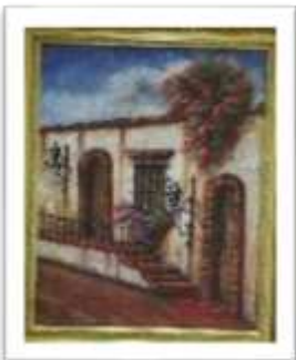
OBR-007887 AUTOR: BOLIVAR QUIÑONES RD$18,000.00