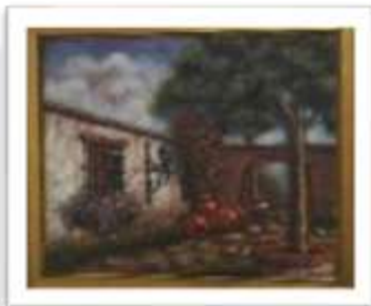
OBR-000114 AUTOR: BOLIVAR QUIÑONES RD$11,000.00