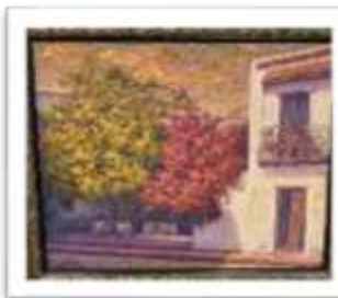
OBR-002208 AUTOR: ROBIN ROQUE GERMAN RD$7,750.00