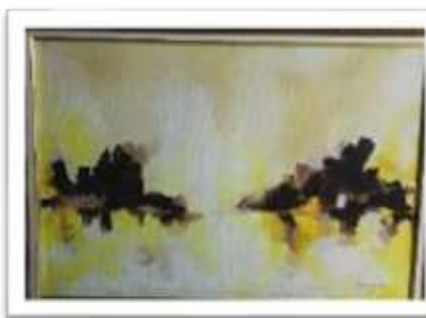
OBR-000014 AUTOR: CAROLINA CEPEDA RD$26,746.00