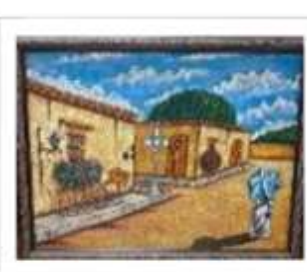
OBR-007885 AUTOR: LUIS A. QUIÑONEZ RD$6,000.00