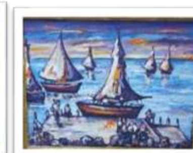
OBR-008307 AUTOR: UBALDO DOMINGUEZ RD$4,500.00