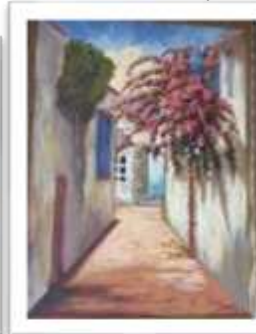
OBR-000205 AUTOR: AMAURYS REYES RD$40,000.00