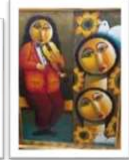
OBR-000171 AUTOR: RAFAEL MARTINEZ RD$7,500.00