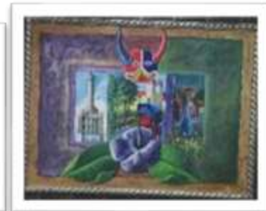
OBR-000217 AUTOR: LUIS A. QUIÑONEZ RD$5,500.00