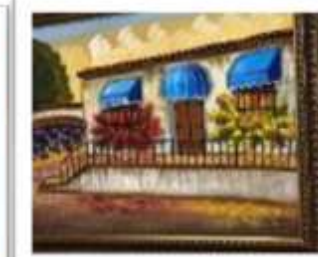
OBR-000170 AUTOR: LEODIN RD$3,000.00