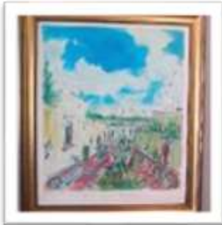
OBR-000009 AUTOR: JUAN CESTERO RD$22,500.00