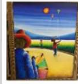
OBR-000070 AUTOR: ALBERTO LESTRAD RD$18,000.00