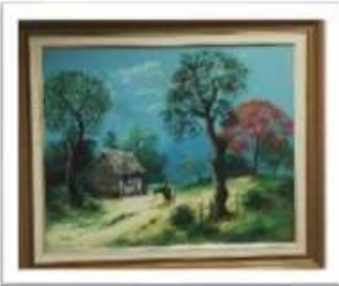
OBR-000010 AUTOR: JUAN EDUARDO RD$12,050.00