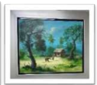
OBR-000033 AUTOR: JUAN EDUARDO RD$24,100.00