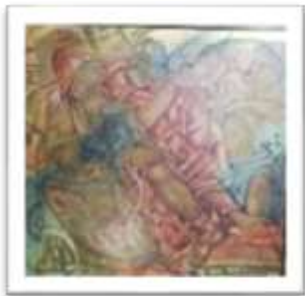
OBR-000153 AUTOR: ANTONIO GUADALUPE RD$440,000.00