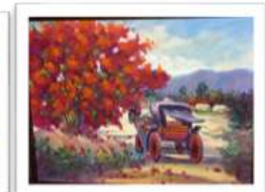
OBR-010773 AUTOR: + A CRUZ RD$9,500.00