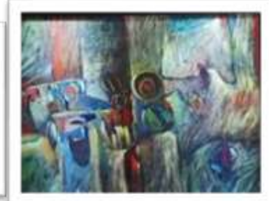
OBR-012989 AUTOR: JUAN BRAVO RD$22,000.00