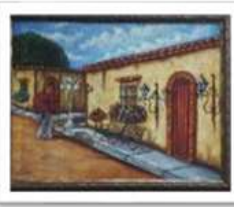
OBR-000219 AUTOR: LUIS A. QUIÑONEZ RD$5,500.00