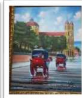
OBR-000060 AUTOR: FREDDY JAVIER RD$15,000.00