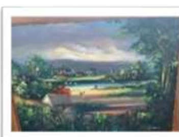
OBR-008509 AUTOR: + A CRUZ RD$5,000.00