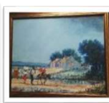
OBR-000039 AUTOR: JUAN RODRIGUEZ RD$50,000.00