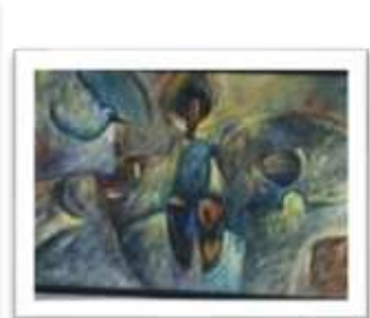
OBR-012990 AUTOR: JUAN BRAVO RD$15,000.00