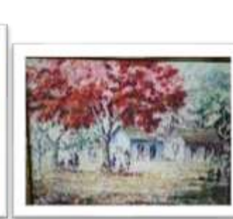
OBR-007948 AUTOR: VICTOR CHEVALIER RD$14,000.00