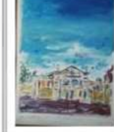
OBR-000057 AUTOR: JUAN CESTERO RD$25,000.00