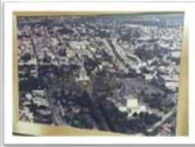
MYE-010023 AUTOR: VICTOR GOMEZ RD$4,000.00