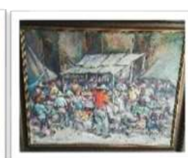
OBR-000064 AUTOR: NEY CRUZ RD$47,500.00