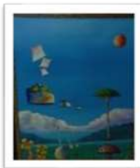
OBR-000214 AUTOR: LEO GUTIERREZ RD$10,000.00