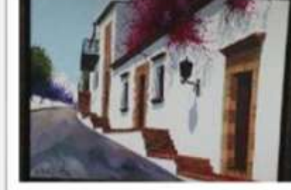
OBR-000056 AUTOR: LUIS OVIEDO RD$10,000.00