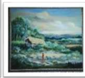
OBR-00077 LAMINA RETOCADA RD$12,500.00