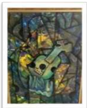
OBR-000189 AUTOR: JHOSY JIMENEZ RD$15,000.00