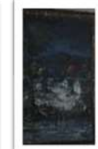
OBR-000143 AUTOR: CHEVALIER RD$15,000.00