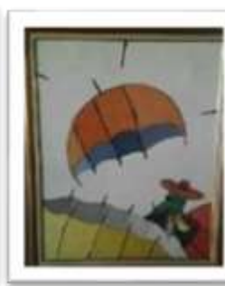
OBR-000023 AUTOR: CLAUDIO P. RD$10,000.00