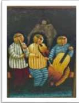
OBR-000212 AUTOR: RAFAEL MARTINEZ RD$7,500.00