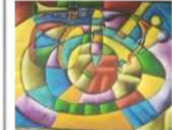
OBR-011720 AUTOR: CIPRIAN RD$12,000.00