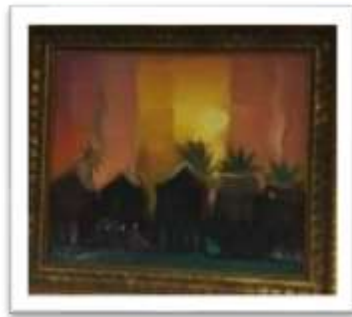
OBR-000020 AUTOR: GUILLO PEREZ RD$100,000.00