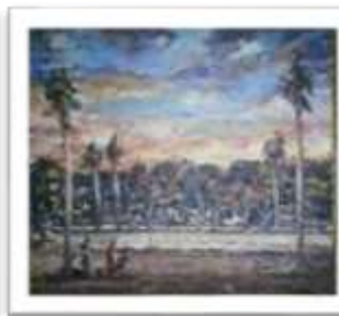
OBR-011808 AUTOR: VICTOR CHEVALIER RD$18,000.00