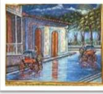
OBR-000177 AUTOR: RAFAEL GARCIA RD$10,000.00