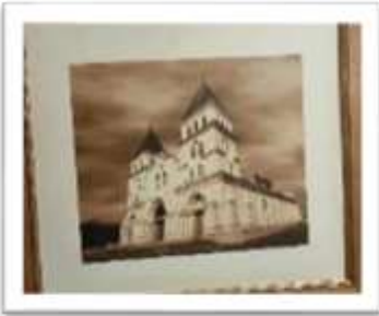
MYE-009538 AUTOR: CESAR PAYAMPS RD$5,000.00