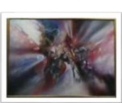
OBR-00081 AUTOR: JUAN BRAVO RD$40,000.00