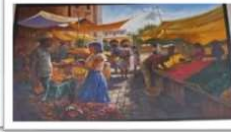
OBR-000178 AUTOR: JUAN EDUARDO RD$80,300.00