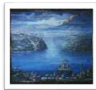
OBR-011807 AUTOR: VICTOR CHEVALIER RD$19,000.00