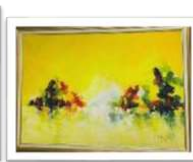
OBR-000024 AUTOR: CAROLINA CEPEDA RD$22,590.00