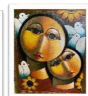
OBR-000146 AUTOR: RAFAEL MARTINEZ RD$22,500.00