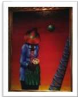
OBR-00080 AUTOR: DIONISIO BLANCO RD$40,000.00