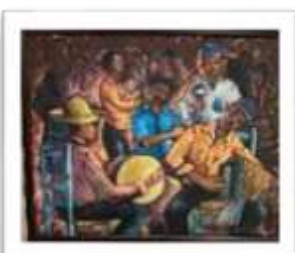
OBR-013439 AUTOR: JOSE MIGUEL PEÑA RD$5,750.00