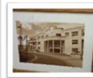
MYE-009633 AUTOR: CESAR PAYAMPS RD$5,000.00