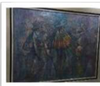
OBR-000066 AUTOR: NEY CRUZ RD$47,500.00