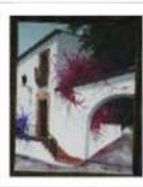
OBR-000053 AUTOR: LUIS OVIEDO RD$10,000.00