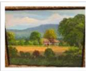
OBR-000201 AUTOR: EDUARDO RODRIGUEZ RD$15,000.00