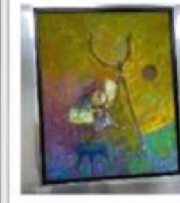
OBR-000071 AUTOR: SILVIO AVILA RD$125,000.00