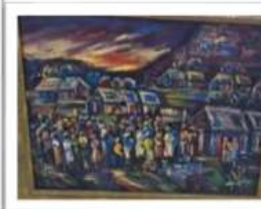
OBR-008306 AUTOR: UBALDO DOMINGUEZ RD$4,500.00