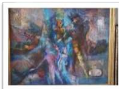
OBR-000065 AUTOR: NEY CRUZ RD$27,000.00