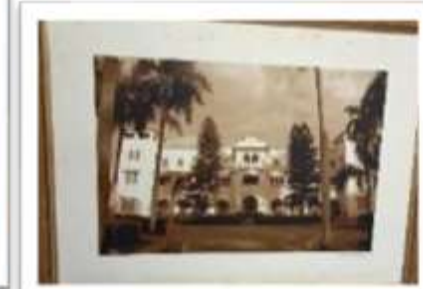
MYE-009542 AUTOR: CESAR PAYAMPS RD$5,000.00