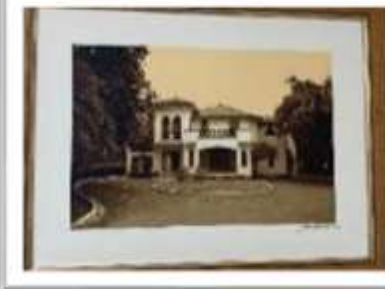
MYE-009541 AUTOR: CESAR PAYAMPS RD$5,000.00