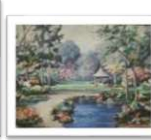
OBR-011822 AUTOR: VICTOR CHEVALIER RD$18,000.00