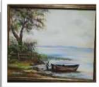
OBR-000203 AUTOR: YOSELINES DOMINGUEZ RD$5,000.00