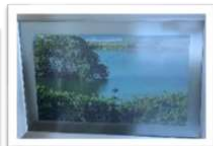
MYE-017072 PEDRO PIÑEYRO RD$5,000.00