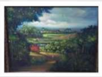
OBR-007884 AUTOR: + A CRUZ RD$7,500.00