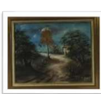
OBR-000036 AUTOR: RAMON ROSARIO RD$2,500.00