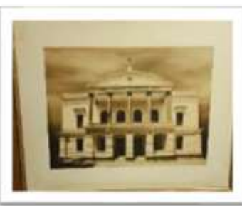
MYE-009539 AUTOR: CESAR PAYAMPS RD$5,000.00