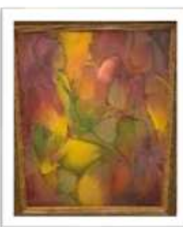
OBR-00082 AUTOR: AMAYA SALAZAR RD$330,000.00