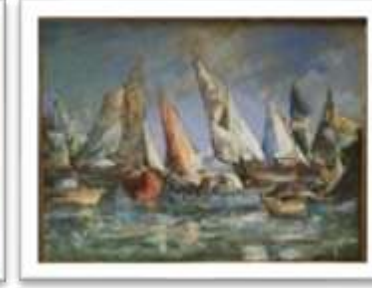
OBR-011820 AUTOR: VICTOR CHEVALIER RD$18,000.00