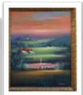
OBR-007886 AUTOR: + A CRUZ RD$3,200.00