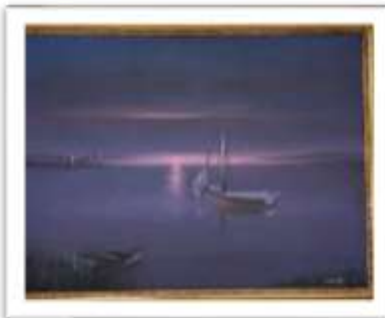
OBR-000209 AUTOR: + A CRUZ RD$13,500.00