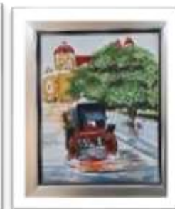
OBR-00102 AUTOR: CARLOS M. GRULLON RD$22,500.00