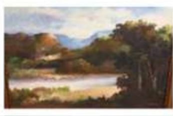
OBR-000202 AUTOR: JONAS RODRIGUEZ RD$9,000.00