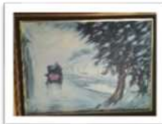
OBR-000106 AUTOR: YORYI MOREL RD$200.00