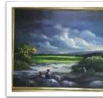
OBR-00104 AUTOR: ALBERTO HOUELLEMONT RD$50,000.00