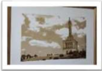
MYE-009634 AUTOR: CESAR PAYAMPS RD$5,000.00