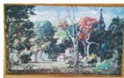
OBR-000186 AUTOR: VICTOR CHEVALIER RD$14,000.00