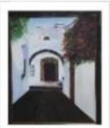
OBR-000155 AUTOR: SONIA VALERIO RD$27,000.00