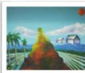
OBR-010765 AUTOR: HECTOR REYNOSO RD$10,000.00