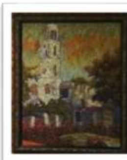
OBR-000059 AUTOR: AMAURYS REYES RD$18,500.00