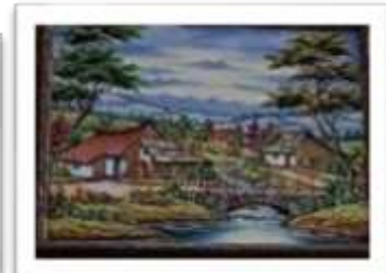
OBR-007951 AUTOR: E. FERNANDO R. RD$9,000.00