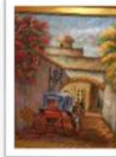
OBR-000197 AUTOR: BOLIVAR QUIÑONES RD$11,000.00