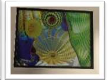
MYE-016323 AUTOR NO IDENTIFICADO RD$2,000.00