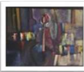
OBR-011717 AUTOR: JUAN BRAVO RD$40,000.00