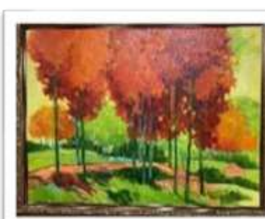
OBR-000188 AUTOR: MONSERRAT MUNNE RD$23,275.00