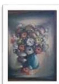
OBR-000141 AUTOR: + A CRUZ RD$4,000.00