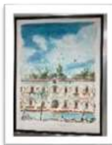
OBR-000044 AUTOR: JUAN CESTERO RD$25,000.00