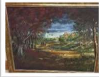
OBR-000175 AUTOR: HOLGER ESCOTO RD$20,000.00