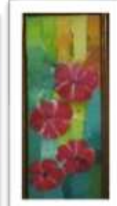
OBR-000142 AUTOR: MIGUEL P. RD$14,000.00