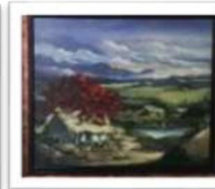
OBR-002209 AUTOR: ALBERTO HOUELLEMONT RD$22,000.00