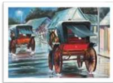
OBR-000134 AUTOR: CARLOS M. GRULLON RD$35,000.00