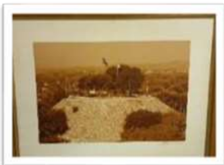
MYE-009625 AUTOR: CESAR PAYAMPS RD$5,000.00