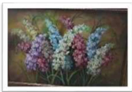
OBR-000208 AUTOR: IVETTE EGA RD$70,000.00