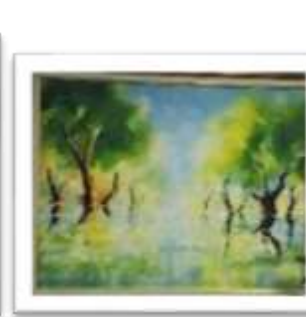
OBR-000025 AUTOR: CAROLINA CEPEDA RD$25,000.00