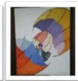
OBR-000031 AUTOR: CLAUDIO PACHECO RD$10,000.00