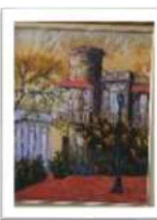
OBR-007936 AUTOR: AMAURYS REYES RD$24,000.00