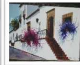
OBR-002282 AUTOR: LUIS OVIEDO RD$20,000.00