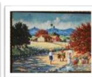
OBR-00090 AUTOR: CLAUDIO PEÑA RD$10,920.00