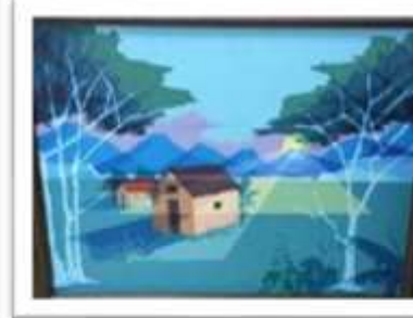
OBR-000193 AUTOR: NORBERTO SANTANA RD$67,000.00