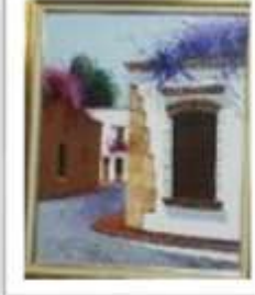
OBR-000054 AUTOR: LUIS OVIEDO RD$30,000.00