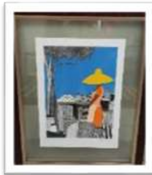
MYE-009898 AUTOR: LUIS AMOR RD$10,000.00