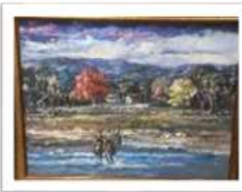
OBR-000128 AUTOR: VICTOR CHEVALIER RD$15,000.00