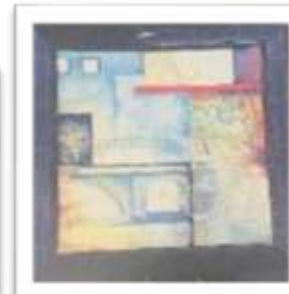
MYE-009629 AUTOR NO IDENTIFICADO RD$1,000.00