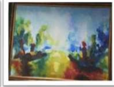
OBR-00076 AUTOR: CAROLINA CEPEDA RD$27,000.00