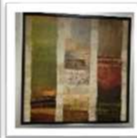
MYE-016321 AUTOR NO IDENTIFICADO RD$2,000.00