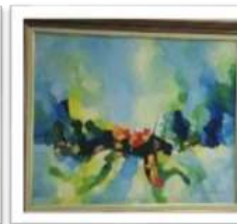
OBR-000018 AUTOR: CAROLINA CEPEDA RD$24,400.00