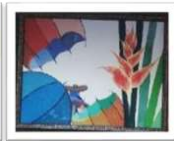
OBR-000029 AUTOR: CLAUDIO PACHECO RD$16,000.00