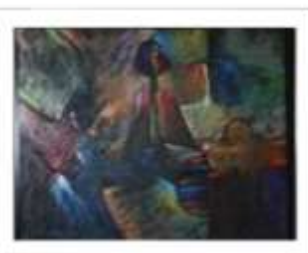
OBR-012991 AUTOR: JUAN BRAVO RD$17,000.00