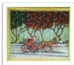
OBR-000050 AUTOR: BOLIVAR QUIÑONES RD$10,000.00