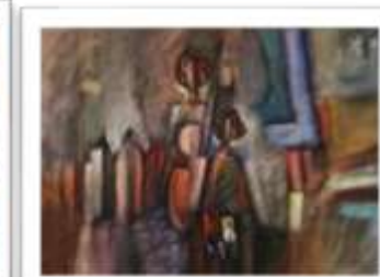
OBR-011805 AUTOR: JUAN BRAVO RD$26,600.00