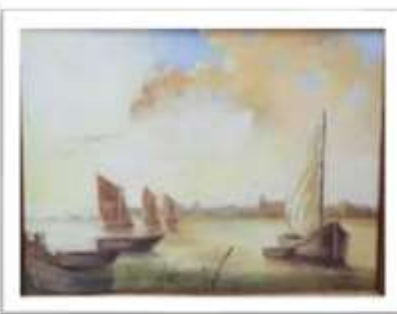
OBR-000210 AUTOR: MARINA ROSON RD$7,000.00