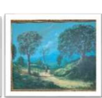
OBR-000026 AUTOR: JUAN EDUARDO RD$24,100.00