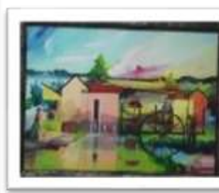
OBR-000218 AUTOR: MIGUEL DOMINGUEZ RD$18,000.00