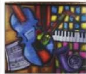
OBR-011719 AUTOR: CIPRIAN RD$12,000.00