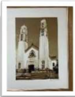
MYE-009540 AUTOR: CESAR PAYAMPS RD$5,000.00