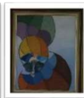
OBR-000017 AUTOR: CLAUDIO PACHECO RD$10,000.00