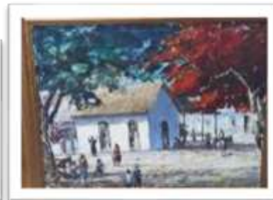
OBR-000132 AUTOR: VICTOR CHEVALIER RD$15,000.00