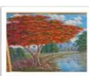
OBR-013522 AUTOR: RAFAEL SANTIAGO RD$20,000.00