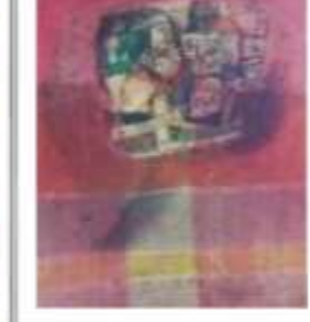
OBR-000072 AUTOR: ANTONIO GUADALUPE RD$440,000.00