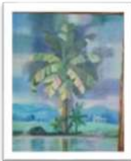
OBR-000165 AUTOR: EDDY SANTIAGO RD$16,000.00