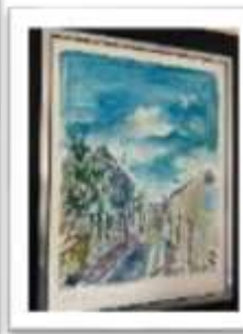
OBR-000176 AUTOR: JUAN CESTERO RD$25,000.00