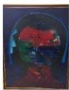
OBR-000185 AUTOR: MIGUEL ULLOA RD$70,000.00