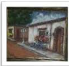
OBR-000131 AUTOR: BOLIVAR Q. RD$11,000.00