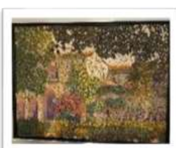
OBR-000151 AUTOR: WILLIAM POUERIET RD$26,000.00