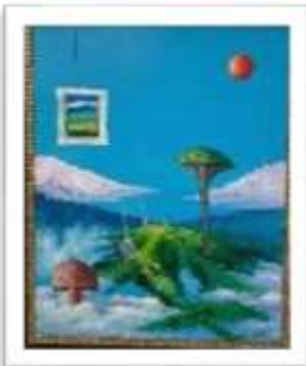
OBR-000215 AUTOR: LEO GUTIERREZ RD$10,000.00