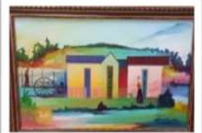
OBR-000166 AUTOR: MIGUEL DOMINGUEZ RD$18,000.00