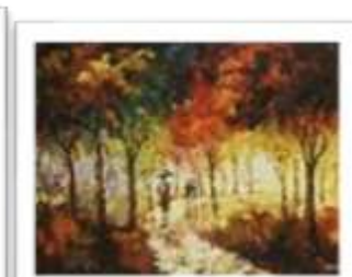
OBR-011806 AUTOR: GILBERTO CRUZ RD$54,000.00