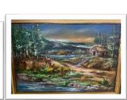
OBR-000043 AUTOR: IVETTE EGA RD$30,000.00