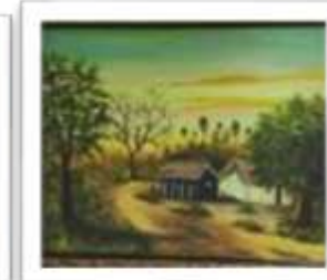
OBR-013525 AUTOR: MARCOS GUZMAN RD$5,000.00