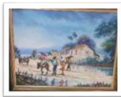
OBR-000211 AUTOR: JUAN RODRIGUEZ RD$50,000.00