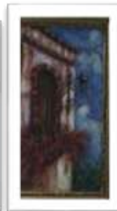
OBR-000129 AUTOR: BOLIVAR Q. RD$11,000.00