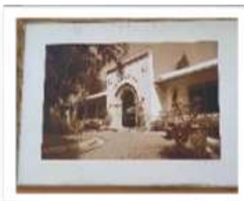
MYE-009619 AUTOR: CESAR PAYAMPS RD$5,000.00