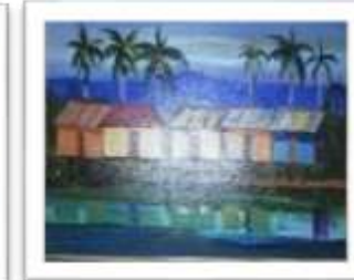
OBR-013528 AUTOR: WILLY PEREZ RD$21,500.00