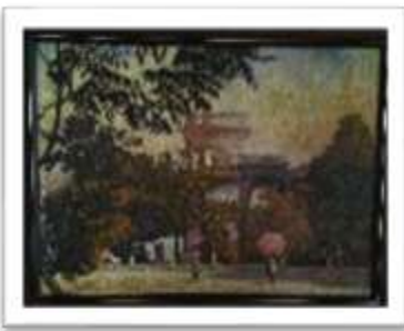
OBR-00074 AUTOR: WILLIAM POUERIET RD$20,000.00