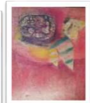
OBR-000150 AUTOR: ANTONIO GUADALUPE RD$440,000.00