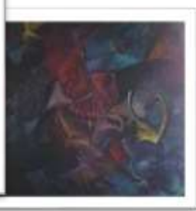
OBR-00078 AUTOR: VALENTIN ACOSTA RD$250,000.00