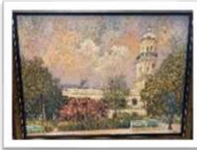
OBR-00075 AUTOR: WILLIAM POUERIET RD$20,000.00