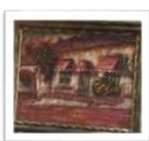
OBR-000115 AUTOR: BOLIVAR QUIÑONES RD$11,000.00