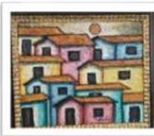
OBR-000216 AUTOR: RAFAEL MARTINEZ RD$3,500.00