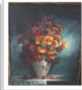
OBR-007943 AUTOR: ALBERTO HOUELLEMONT RD$10,000.00