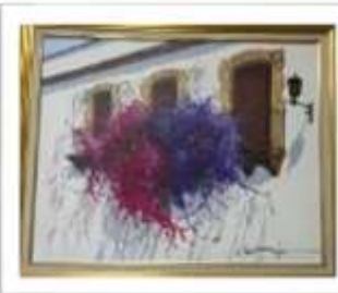
OBR-000052 AUTOR: LUIS OVIEDO RD$30,000.00