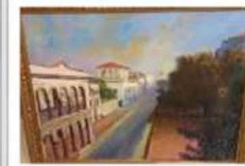
OBR-000169 AUTOR: WILLIAM POUERIET RD$18,000.00