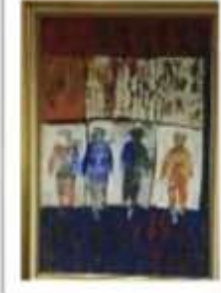
OBR-000068 AUTOR: LUZ SEVERINO RD$275,000.00