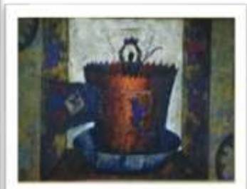
OBR-000147 AUTOR: BERNARDO THEN RD$30,000.00