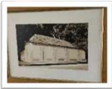
MYE-009536 AUTOR: CESAR PAYAMPS RD$5,000.00