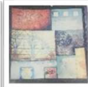
MYE-009630 AUTOR NO IDENTIFICADO RD$1,000.00