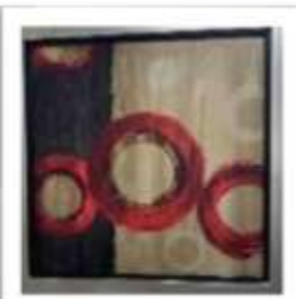
MYE-016320 AUTOR NO IDENTIFICADO RD$2,000.00