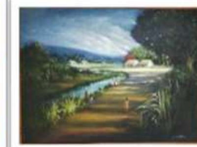
OBR-008513 AUTOR: + A CRUZ RD$6,000.00