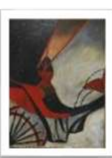
OBR-007935 AUTOR: FELA DE ANTUÑAMO RD$15,000.00