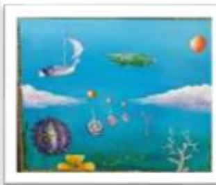
OBR-000213 AUTOR: LEO GUTIERREZ RD$10,000.00