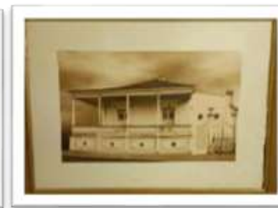
MYE-009622 AUTOR: CESAR PAYAMPS RD$5,000.00