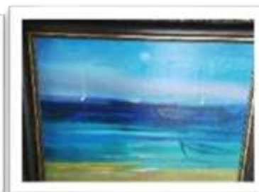
OBR-00091 AUTOR: WILLY PEREZ RD$21,500.00