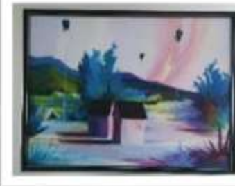
OBR-000055 AUTOR: MIGUEL DOMINGUEZ RD$18,000.00