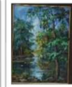
OBR-000144 AUTOR: IVETTE EGA RD$70,000.00