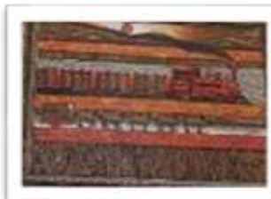
OBR-007950 AUTOR: RAFAEL MARTINEZ RD$12,500.00