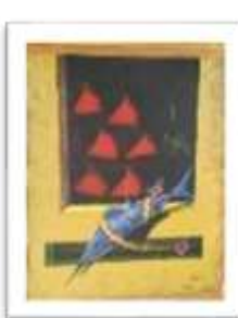
OBR-000136 AUTOR: BERNARDO THEN RD$30,000.00