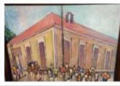
OBR-000204 AUTOR: NEY CRUZ RD$17,000.00