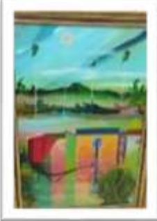
OBR-000167 AUTOR: MIGUEL DOMINGUEZ RD$18,000.00