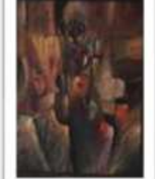
OBR-011718 AUTOR: JUAN BRAVO RD$40,000.00