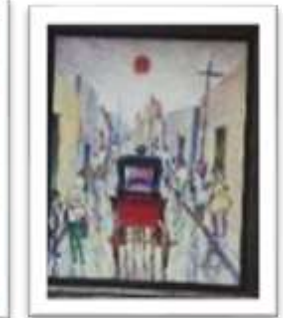
OBR-000164 AUTOR: NEY CRUZ RD$9,000.00