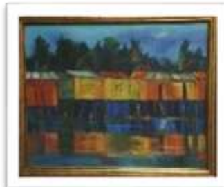
OBR-00089 AUTOR: WILLY PEREZ RD$22,500.00