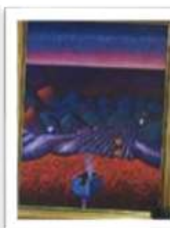
OBR-000061 AUTOR: DIONISIO BLANCO RD$40,000.00