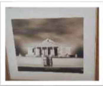
MYE-009623 AUTOR: CESAR PAYAMPS RD$5,000.00