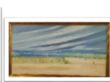
OBR-000042 AUTOR: DANIEL VARGAS RD$12,000.00