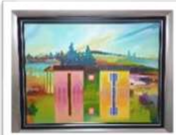
OBR-000160 AUTOR: MIGUEL DOMINGUEZ RD$18,000.00