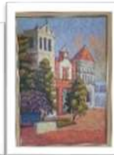
OBR-002281 AUTOR: AMAURYS REYES RD$30,000.00