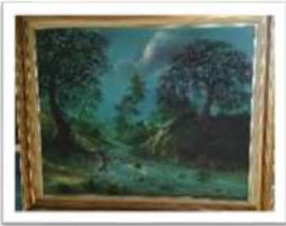
OBR-000001 AUTOR: JUAN EDUARDO RD$40,000.00