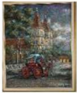
OBR-000181 AUTOR: BOLIVAR QUIÑONES RD$18,000.00