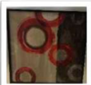
MYE-016319 AUTOR NO IDENTIFICADO RD$2,000.00