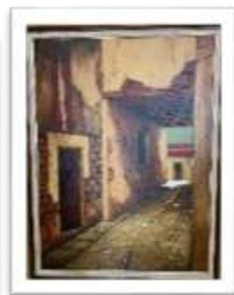
OBR-000038 AUTOR: CASTELLOTE RD$11,000.00