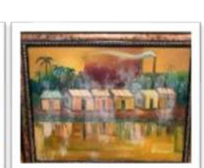
OBR-00088 AUTOR: WILLY PEREZ RD$32,500.00