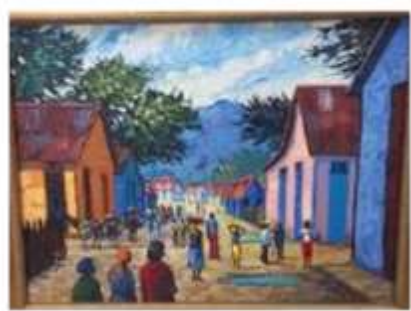
OBR-000183 AUTOR: RAFAEL AYBAR RD$15,000.00