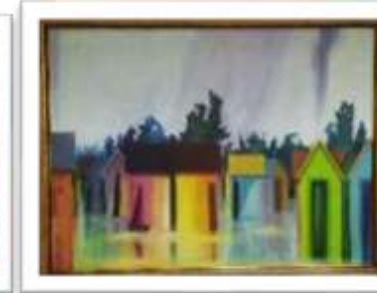
OBR-000046 AUTOR: MIGUEL DOMINGUEZ RD$10,000.00