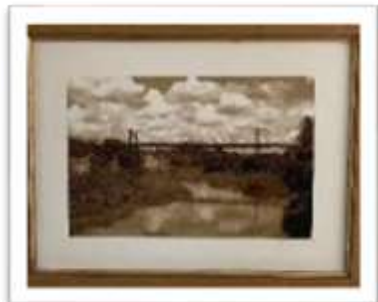
MYE-009544 AUTOR: CESAR PAYAMPS RD$5,000.00