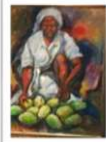
OBR-000148 AUTOR: NEY CRUZ RD$21,500.00