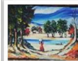
OBR-011725 AUTOR: UBALDO DOMINGUEZ RD$10,000.00