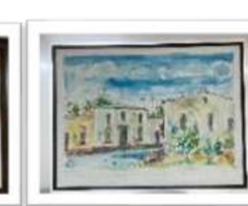
OBR-000049 AUTOR: JUAN CESTERO RD$25,000.00