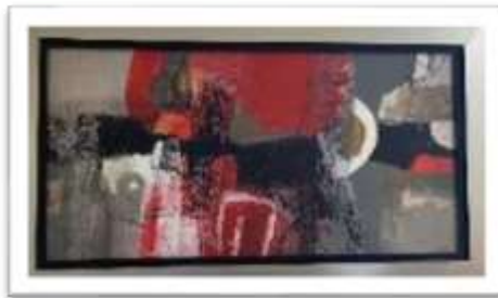
MYE-016318 AUTOR: MAURICIO PIOVAN RD$2,000.00