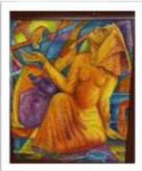
OBR-000159 AUTOR: JULIO SUSANA RD$75,000.00