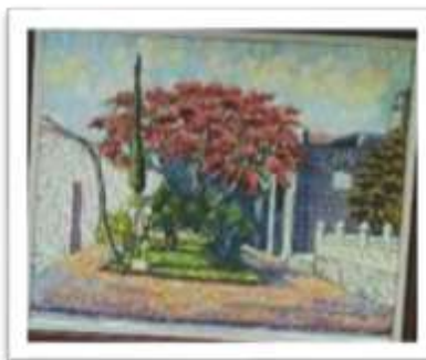
OBR-000058 AUTOR: AMAURYS REYES RD$40,000.00