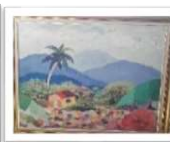
OBR-000045 AUTOR: CLAUDIO PACHECO RD$16,000.00