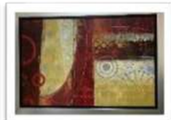
MYE-016326 AUTOR NO IDENTIFICADO RD$2,000.00