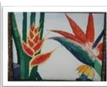
OBR-000030 AUTOR: CLAUDIO PACHECO RD$16,000.00