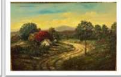
OBR-000179 AUTOR: JUAN EDUARDO RD$80,300.00