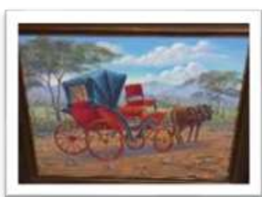
OBR-000034 AUTOR: RAFAEL SANTIAGO RD$18,000.00