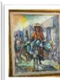
OBR-000063 AUTOR: NEY CRUZ RD$9,000.00