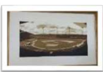
MYE-009635 AUTOR: CESAR PAYAMPS RD$5,000.00