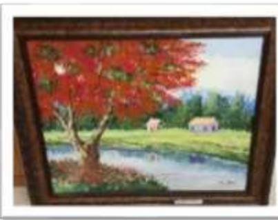
OBR-000003 AUTOR: TONY PEREZ RD$5,000.00