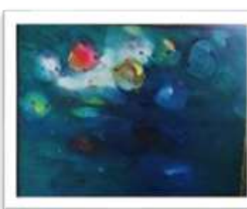
OBR-000137 AUTOR: MIGUEL PINEDA RD$8,500.00