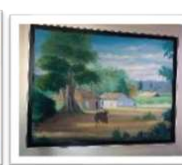
OBR-000041 AUTOR: + A CRUZ RD$6,640.00