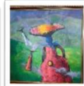
OBR-000133 AUTOR: CHIQUI MENDOZA RD$318,000.00