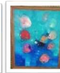
OBR-000138 AUTOR: MIGUEL PINEDA RD$6,000.00