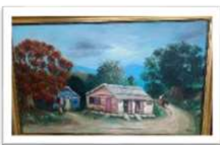
OBR-000027 AUTOR: JUAN EDUARDO RD$50,128.00