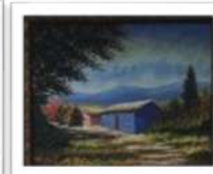
OBR-013526 AUTOR: JOHNNY SEGURA RD$12,500.00