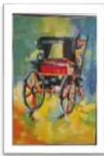
OBR-000021 AUTOR: CAROLINA RD$30,000.00