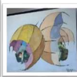
OBR-000007 AUTOR: CLAUDIO PACHECO RD$10,000.00