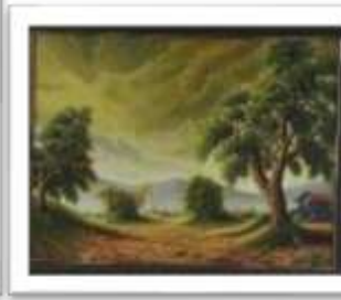
OBR-000220 AUTOR: MAX ARIAS RD$8,000.00