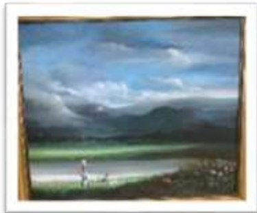
OBR-000180 AUTOR: ALBERTO HOUELLEMONT RD$50,000.00