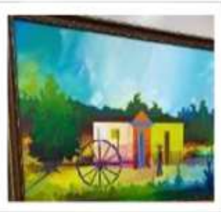
OBR-000200 AUTOR: MIGUEL DOMINGUEZ RD$18,000.00