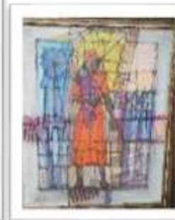
OBR-007944 AUTOR: CUQUITO PEÑA RD$75,000.00