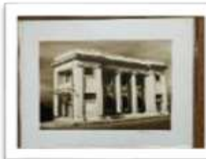
MYE-009626 AUTOR: CESAR PAYAMPS RD$5,000.00