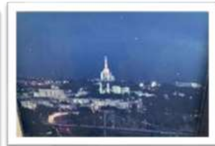
MYE-010024 AUTOR: VICTOR GOMEZ RD$4,000.00