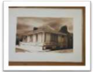
MYE-014982 AUTOR: CESAR PAYAMPS RD$5,000.00