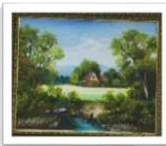
OBR-000028 AUTOR: SONIA VALERIO RD$5,000.00