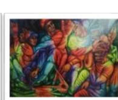
OBR-00087 AUTOR: JUSTO SUSANA RD$67,000.00