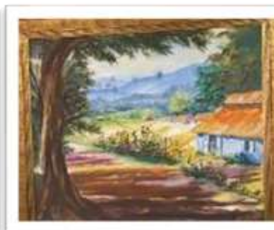
OBR-000062 AUTOR: MARIO GRULLÓN RD$26,850.00