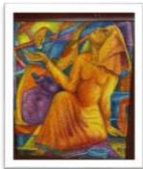
OBR-000159 AUTOR: JULIO SUSANA RD$75,000.00