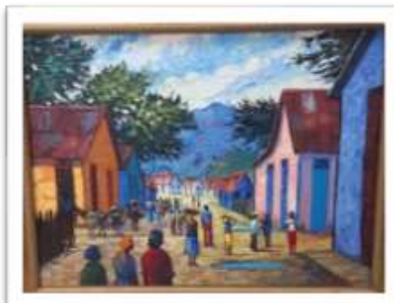
OBR-000183 AUTOR: RAFAEL AYBAR RD$15,000.00