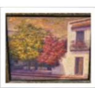
OBR-002208 AUTOR: ROBIN ROQUE GERMÁN RD$7,750.00