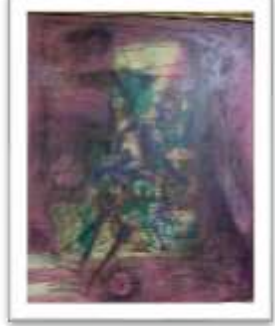
OBR-00084 AUTOR: ANTONIO GUADALUPE RD$77,300.00