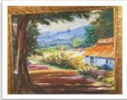
OBR-000062 AUTOR: MARIO GRULLÓN RD$26,850.00