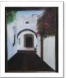
OBR-000155 AUTOR: SONIA VALERIO RD$27,000.00