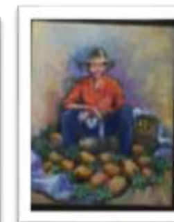
OBR-000194 AUTOR: NEY CRUZ RD$18,000.00