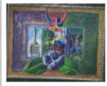
OBR-000217 AUTOR: LUIS A. QUIÑONEZ RD$5,500.00