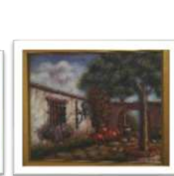
OBR-000114 AUTOR: BOLIVAR QUIÑONES RD$11,000.00