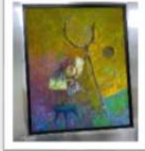
OBR-000071 AUTOR: SILVIO AVILA RD$125,000.00