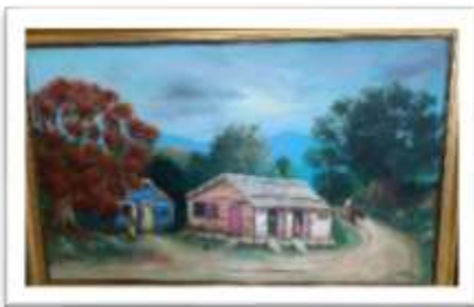
OBR-00027 AUTOR: JUAN EDUARDO RD$50,128.00