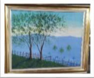
OBR-000004 AUTOR: EUSEBIO VIDAL RD$7,000.00