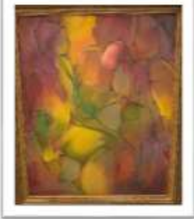
OBR-00082 AUTOR: AMAYA SALAZAR RD$330,000.00