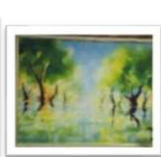
OBR-000025 AUTOR: CAROLINA CEPEDA RD$25,000.00