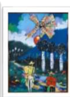
OBR-007888 AUTOR: CLAUDIO P. RD$16,000.00