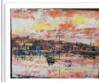
OBR-007953 AUTOR: UBALDO DOMINGUEZ RD$2,750.00