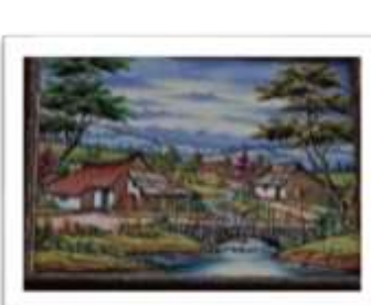
OBR-007951 AUTOR: E. FERNANDO R. RD$9,000.00