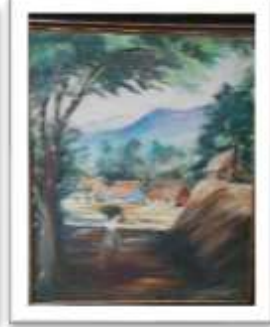
OBR-000173 AUTOR: CARLOS M. GRULLÓN RD$18,000.00