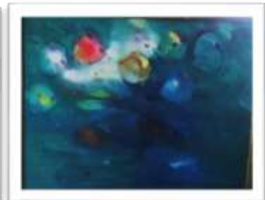
OBR-000137 AUTOR: MIGUEL PINEDA RD$8,500.00