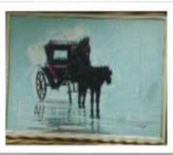
OBR-000019 AUTOR: JUAN EDUARDO RD$40,000.00