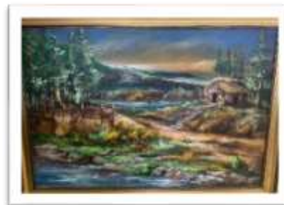
OBR-00043 AUTOR: IVETTE EGA RD$30,000.00