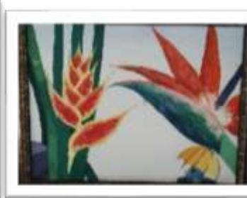
OBR-00030 AUTOR: CLAUDIO PACHECO RD$16,000.00