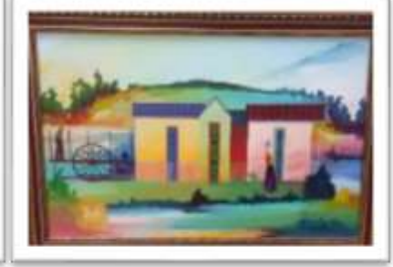
OBR-000166 AUTOR: MIGUEL DOMINGUEZ RD$18,000.00