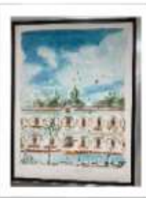
OBR-00044 AUTOR: JUAN CESTERO RD$25,000.00