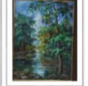
OBR-000144 AUTOR: IVETTE EGA RD$70,000.00