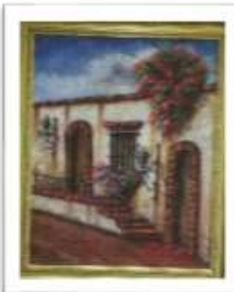
OBR-007887 AUTOR: BOLIVAR QUIÑONES RD$18,000.00