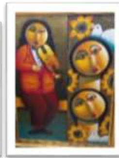
OBR-000171 AUTOR: RAFAEL MARTÍNEZ RD$7,500.00