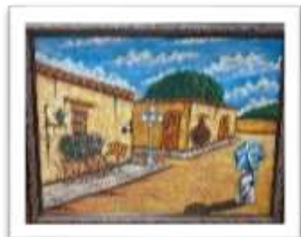
OBR-007885 AUTOR: LUIS A. QUIÑONEZ RD$6,000.00