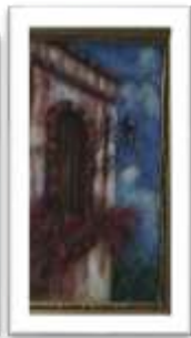
OBR-000129 AUTOR: BOLIVAR Q. RD$11,000.00