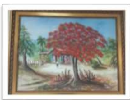
OBR-000015 AUTOR: RAMÓN ROSARIO RD$2,000.00