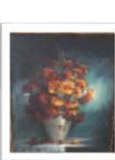
OBR-007943 AUTOR: ALBERTO HOUELLEMONT RD$10,000.00