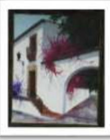
OBR-000053 AUTOR: LUIS OVIEDO RD$10,000.00