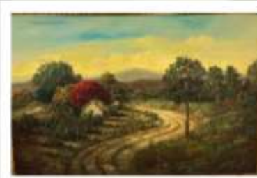
OBR-000179 AUTOR: JUAN EDUARDO RD$80,300.00