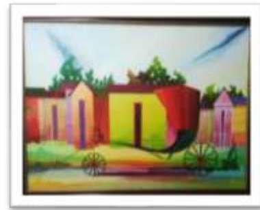
OBR-000168 AUTOR: MIGUEL DOMINGUEZ RD$18,000.00