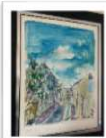
OBR-000176 AUTOR: JUAN CESTERO RD$25,000.00