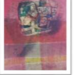
OBR-000072 AUTOR: ANTONIO GUADALUPE RD$440,000.00