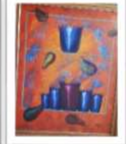
OBR-000139 AUTOR: BERNARDO T. RD$30,000.00