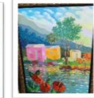
OBR-000198 AUTOR: CAROLINA CEPEDA RD$30,000.00