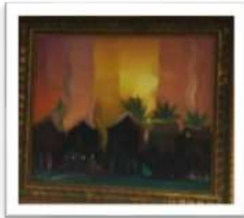
OBR-000020 AUTOR: GUILLO PÉREZ RD$100,000.00