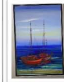
OBR-000190 AUTOR: WILLY PÉREZ RD$37,500.00