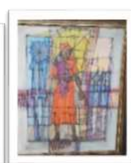
OBR-007944 AUTOR: CUQUITO PEÑA RD$75,000.00