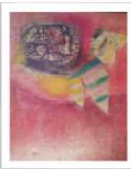
OBR-000150 AUTOR: ANTONIO GUADALUPE RD$440,000.00