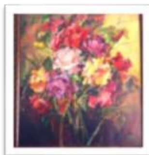
OBR-000191 AUTOR: IVETTE EGA RD$90,000.00