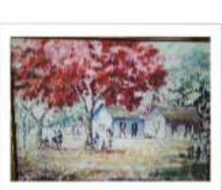
OBR-007948 AUTOR: VICTOR CHEVALIER RD$14,000.00