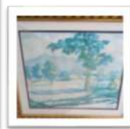
OBR-00097 AUTOR: YORYI MOREL RD$200.00