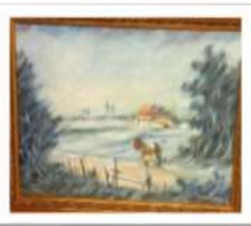
OBR-000002 AUTOR: JUAN RODRÍGUEZ RD$50,000.00