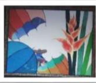
OBR-00029 AUTOR: CLAUDIO PACHECO RD$16,000.00