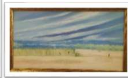
OBR-00042 AUTOR: DANIEL VARGAS RD$12,000.00