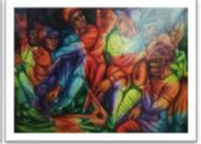
OBR-00087 AUTOR: JULIO SUSANA RD$67,000.00