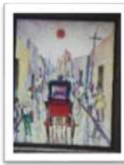
OBR-000164 AUTOR: NEY CRUZ RD$9,000.00