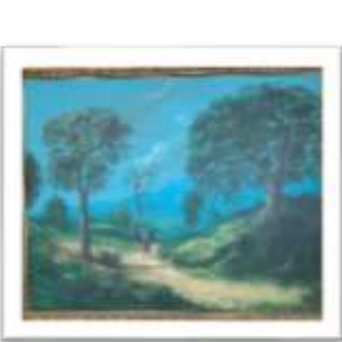
OBR-000026 AUTOR: JUAN EDUARDO RD$24,100.00