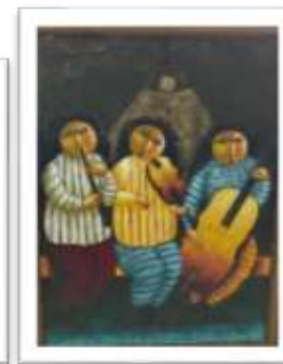
OBR-000212 AUTOR: RAFAEL MARTÍNEZ RD$7,500.00