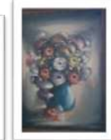
OBR-000141 AUTOR: + A CRUZ RD$4,000.00