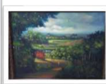
OBR-007884 AUTOR: + A CRUZ RD$7,500.00