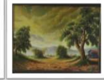
OBR-000220 AUTOR: MAX ARIAS RD$8,000.00