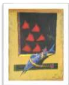
OBR-000136 AUTOR: BERNARDO THEN RD$30,000.00