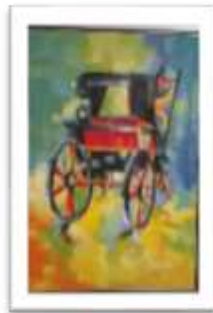
OBR-000021 AUTOR: CAROLINA RD$30,000.00