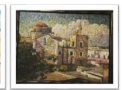
OBR-000135 AUTOR: WILLIAM POUERIET RD$18,000.00