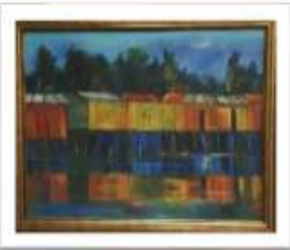
OBR-00089 AUTOR: WILLY PÉREZ RD$22,500.00