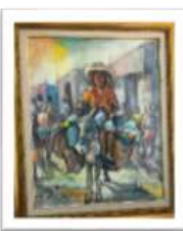
OBR-000063 AUTOR: NEY CRUZ RD$9,000.00