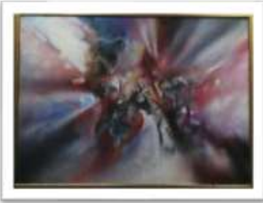
OBR-00081 AUTOR: JUAN BRAVO RD$40,000.00