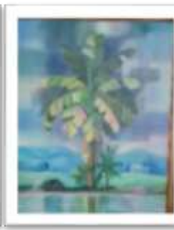
OBR-000165 AUTOR: EDDY SANTIAGO RD$16,000.00