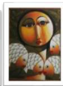
OBR-00092 AUTOR: RAFAEL M. RD$7,500.00