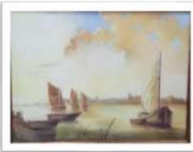
OBR-000210 AUTOR: MARINA ROSON RD$7,000.00