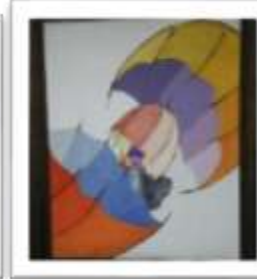
OBR-00031 AUTOR: CLAUDIO PACHECO RD$10,000.00