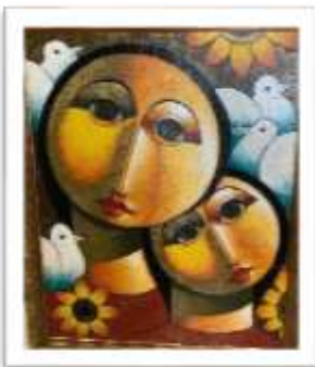
OBR-000146 AUTOR: RAFAEL MARTÍNEZ RD$22,500.00