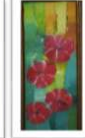
OBR-000142 AUTOR: MIGUEL P. RD$14,000.00