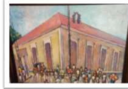
OBR-00024 AUTOR: NEY CRUZ RD$17,000.00