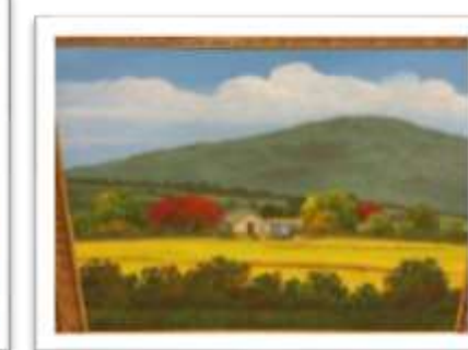
OBR-000199 AUTOR: EDUARDO RODRÍGUEZ RD$15,000.00