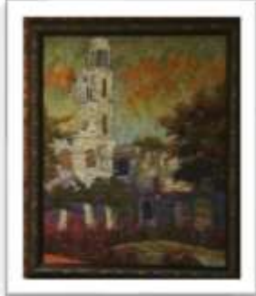
OBR-000059 AUTOR: AMAURYS REYES RD$18,500.00