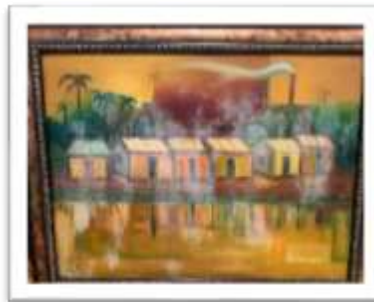
OBR-00088 AUTOR: WILLY PÉREZ RD$32,500.00