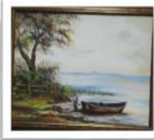
OBR-00023 AUTOR: YOSELINES DOMINGUEZ RD$5,000.00