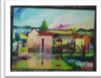
OBR-000218 AUTOR: MIGUEL DOMÍNGUEZ RD$18,000.00