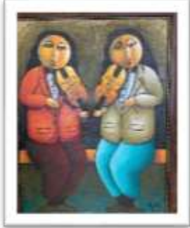
OBR-000163 AUTOR: RAFAEL MARTÍNEZ RD$7,500.00