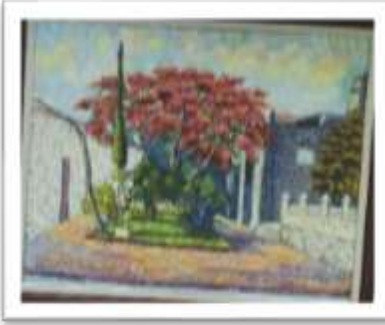
OBR-000058 AUTOR: AMAURYS REYES RD$40,000.00