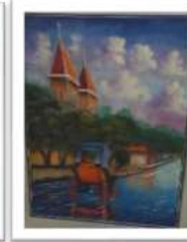
OBR-00026 AUTOR: JOSE GERMOSEN RD$2,000.00