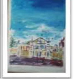
OBR-000057 AUTOR: JUAN CESTERO RD$25,000.00