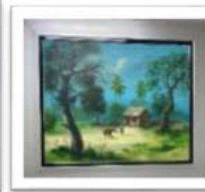
OBR-00033 AUTOR: JUAN EDUARDO RD$24,100.00