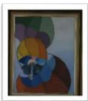
OBR-000017 AUTOR: CLAUDIO PACHECO RD$10,000.00