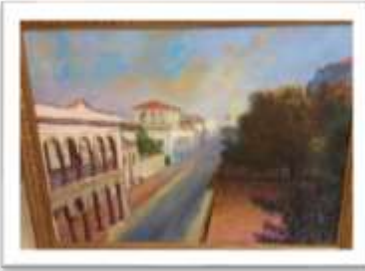
OBR-000169 AUTOR: WILLIAM POUERIET RD$18,000.00