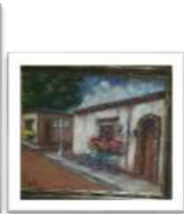
OBR-000131 AUTOR: BOLIVAR Q. RD$11,000.00