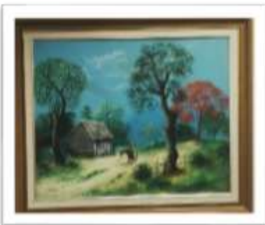
OBR-000010 AUTOR: JUAN EDUARDO RD$12,050.00