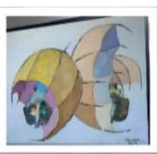
OBR-000007 AUTOR: CLAUDIO PACHECO RD$10,000.00