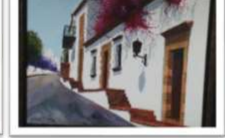
OBR-000056 AUTOR: LUIS OVIEDO RD$10,000.00