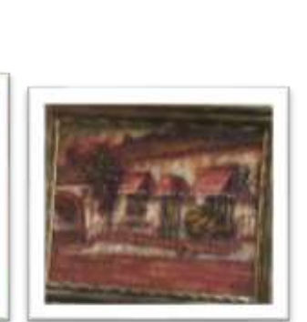
OBR-000115 AUTOR: BOLIVAR QUIÑONES RD$11,000.00