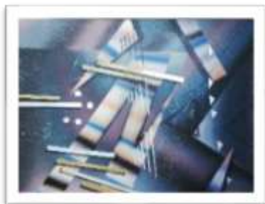
OBR-000221 (LAMINA) RD$2,000.00