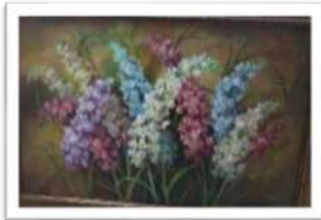
OBR-00028 AUTOR: IVETTE EGA RD$70,000.00