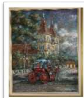
OBR-000181 AUTOR: BOLIVAR QUIÑONES RD$18,000.00