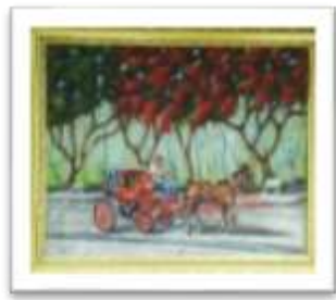
OBR-000050 AUTOR: BOLIVAR QUIÑONES RD$10,000.00