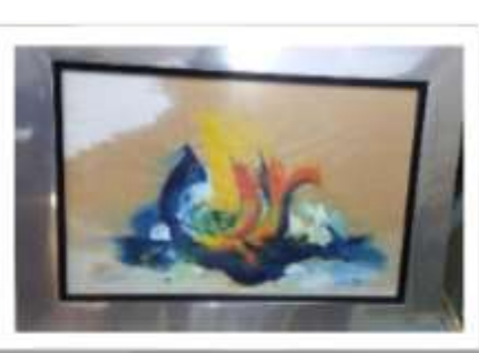
OBR-000008 AUTOR: CAROLINA CEPEDA RD$25,000.00