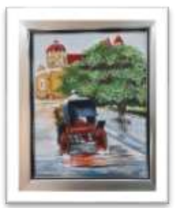
OBR-000102 AUTOR: CARLOS M. GRULLÓN RD$22,500.00