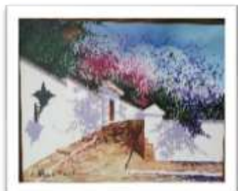
OBR-007945 AUTOR: LUIS OVIEDO RD$17,500.00