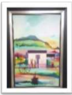
OBR-000161 AUTOR: MIGUEL DGEZ RD$18,000.00