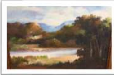
OBR-00022 AUTOR: JONAS RODRÍGUEZ RD$9,000.00