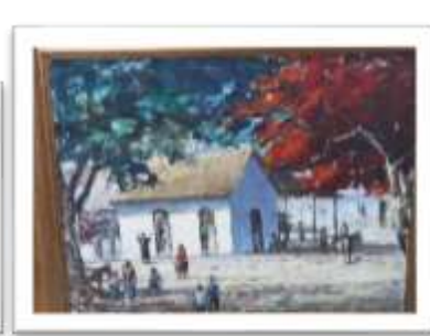
OBR-000132 AUTOR: VICTOR CHEVALIER RD$15,000.00