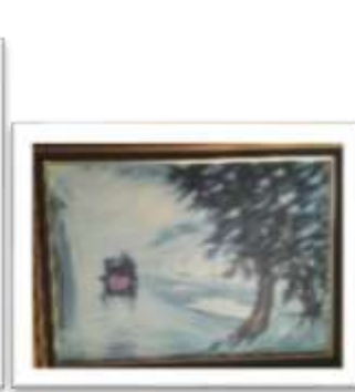
OBR-000106 AUTOR: YORYI MOREL RD$200.00