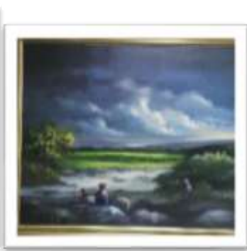
OBR-000104 AUTOR: ALBERTO HOUELLEMONT RD$50,000.00