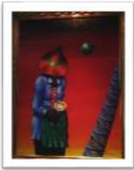
OBR-00080 AUTOR: DIONISIO BLANCO RD$40,000.00