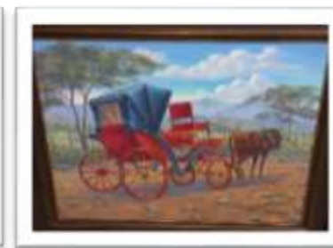
OBR-00034 AUTOR: RAFAEL SANTIAGO RD$18,000.00