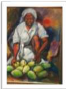
OBR-000148 AUTOR: NEY CRUZ RD$21,500.00