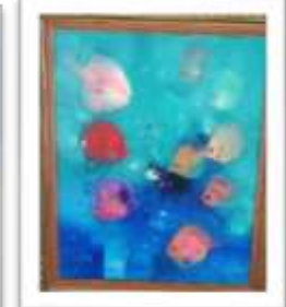
OBR-000138 AUTOR: MIGUEL PINEDA RD$6,000.00