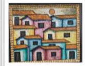
OBR-000216 AUTOR: RAFAEL MARTÍNEZ RD$3,500.00