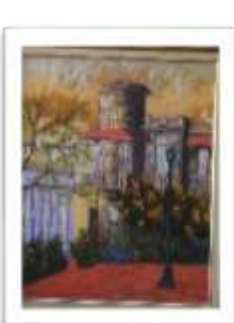
OBR-007936 AUTOR: AMAURYS REYES RD$24,000.00