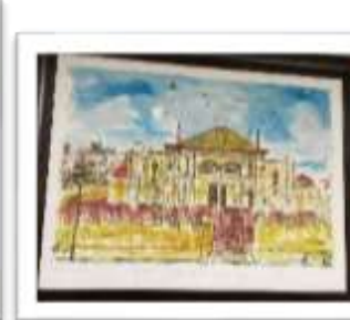
OBR-00048 AUTOR: JUAN CESTERO RD$25,000.00