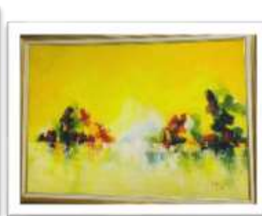
OBR-000024 AUTOR: CAROLINA CEPEDA RD$22,590.00