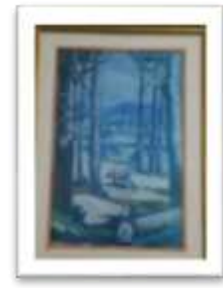
OBR-00099 AUTOR: YORYI MOREL RD$200.00