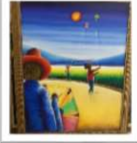
OBR-000070 AUTOR: ALBERTO LESTRAD RD$18,000.00