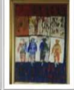
OBR-000068 AUTOR: LUZ SEVERINO RD$275,000.00