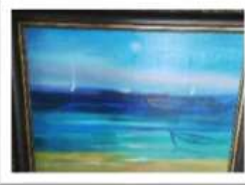
OBR-00091 AUTOR: WILLY PEREZ RD$21,500.00