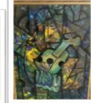
OBR-000189 AUTOR: JHOSY JIMENEZ RD$15,000.00