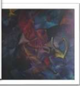
OBR-00078 AUTOR: VALENTIN ACOSTA RD$250,000.00