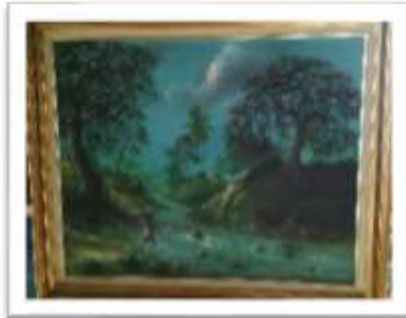
OBR-000001 AUTOR: JUAN EDUARDO RD$40,000.00