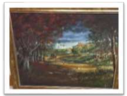
OBR-000175 AUTOR: HOLGER ESCOTO RD$20,000.00