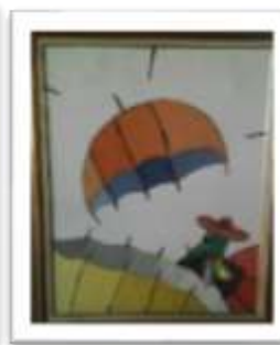
OBR-000023 AUTOR: CLAUDIO P. RD$10,000.00