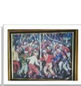
OBR-000107 AUTOR: YORYI MOREL RD$200.00