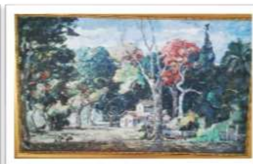
OBR-000186 AUTOR: VICTOR CHEVALIER RD$14,000.00