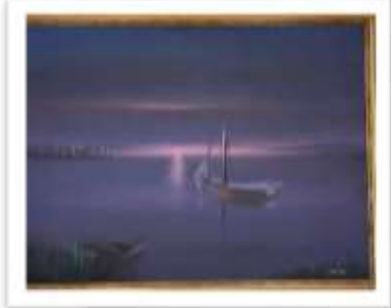
OBR-00029 AUTOR: + A CRUZ RD$13,500.00