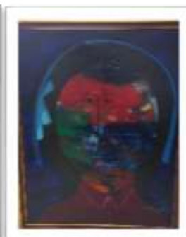
OBR-000185 AUTOR: MIGUEL ULLOA RD$70,000.00