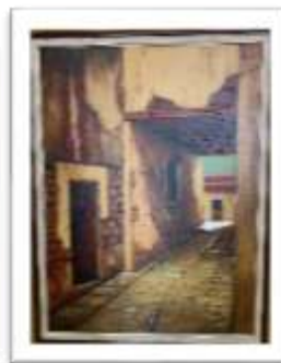
OBR-00038 AUTOR: CASTELLOTE RD$11,000.00