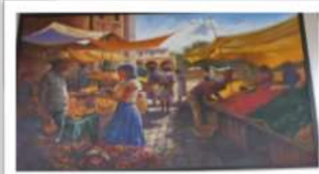
OBR-000178 AUTOR: JUAN EDUARDO RD$80,300.00