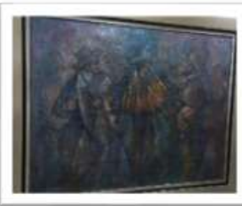
OBR-000066 AUTOR: NEY CRUZ RD$47,500.00