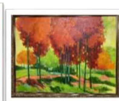
OBR-000188 AUTOR: MONSERRAT MUNNE RD$23,275.00