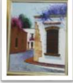
OBR-000054 AUTOR: LUIS OVIEDO RD$30,000.00