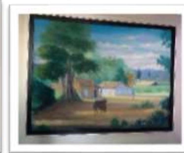
OBR-00041 AUTOR: + A CRUZ RD$6,640.00