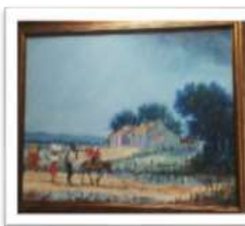
OBR-00039 AUTOR: JUAN RODRIGUEZ RD$50,000.00