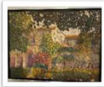
OBR-000151 AUTOR: WILLIAM POUERIET RD$26,000.00