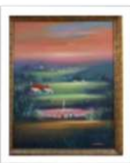
OBR-007886 AUTOR: + A CRUZ RD$3,200.00