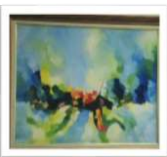
OBR-000018 AUTOR: CAROLINA CEPEDA RD$24,400.00