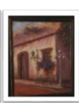
OBR-000105 AUTOR: BOLIVAR Q. RD$11,000.00