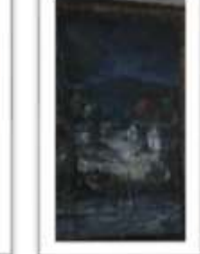
OBR-000143 AUTOR: CHEVALIER RD$15,000.00