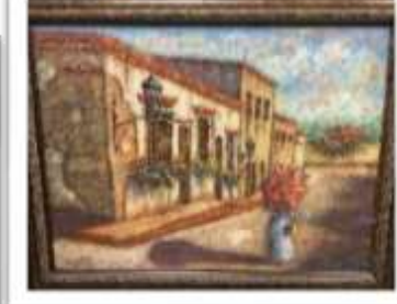
OBR-007952 AUTOR: BOLIVAR QUIÑONES RD$18,000.00