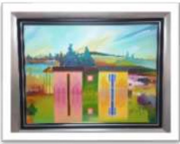
OBR-000160 AUTOR: MIGUEL DOMINGUEZ RD$18,000.00