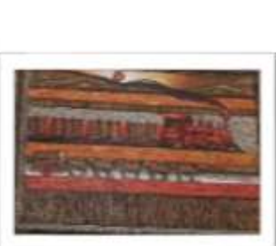
OBR-007950 AUTOR: RAFAEL MARTÍNEZ RD$12,500.00