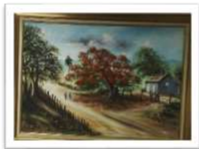
OBR-00035 AUTOR: RAMON ROSARIO RD$4,500.00