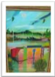
OBR-000167 AUTOR: MIGUEL DOMINGUEZ RD$18,000.00