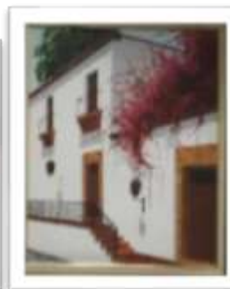
OBR-002283 AUTOR: LUIS OVIEDO RD$12,500.00