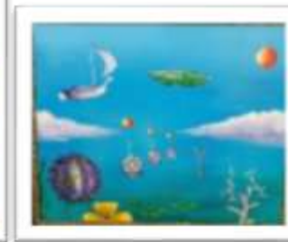
OBR-000213 AUTOR: LEO GUTIÉRREZ RD$10,000.00