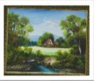
OBR-00028 AUTOR: SONIA VALERIO RD$5,000.00