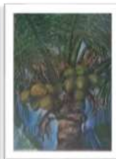
OBR-000192 AUTOR: IVETTE EGA RD$95,000.00