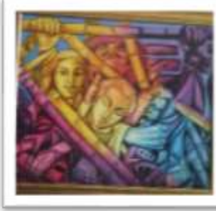
OBR-00086 AUTOR: JULIO SUSANA RD$229,000.00