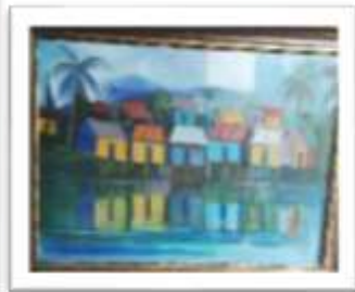
OBR-000154 AUTOR: WILLY PÉREZ RD$30,000.00