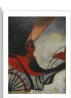
OBR-007935 AUTOR: FELA DE ANTUÑAMO RD$15,000.00