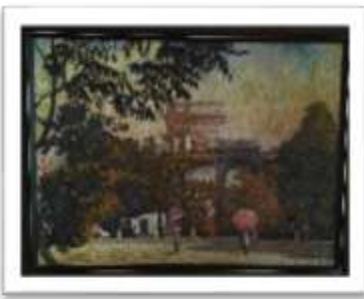
OBR-00074 AUTOR: WILLIAM POUERIET RD$20,000.00