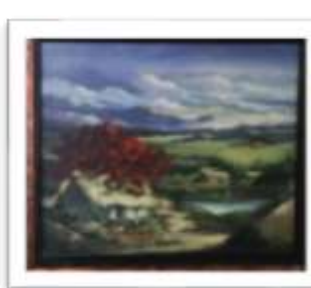
OBR-002209 AUTOR: ALBERTO HOUELLEMONT RD$22,000.00