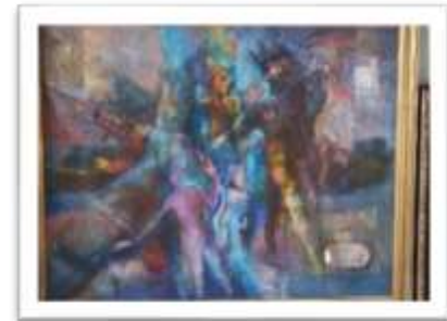
OBR-000065 AUTOR: NEY CRUZ RD$27,000.00