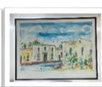
OBR-00049 AUTOR: JUAN CESTERO RD$25,000.00