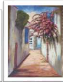
OBR-00025 AUTOR: AMAURYS REYES RD$40,000.00