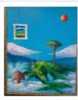
OBR-000215 AUTOR: LEO GUTIÉRREZ RD$10,000.00