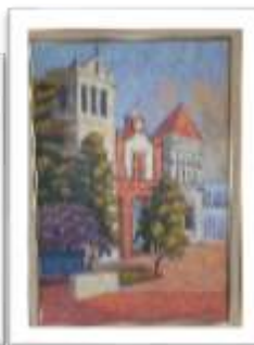
OBR-002281 AUTOR: AMAURYS REYES RD$30,000.00