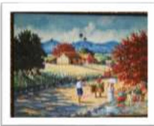
OBR-00090 AUTOR: CLAUDIO PEÑA RD$10,920.00