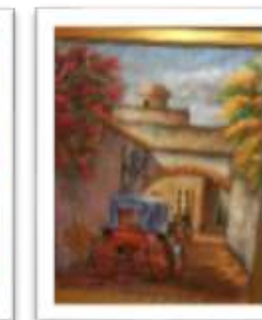
OBR-000197 AUTOR: BOLIVAR QUIÑONES RD$11,000.00