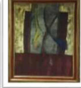
OBR-000067 AUTOR: LUZ SEVERINO RD$275,000.00