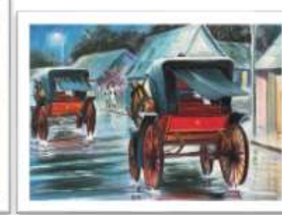
OBR-000134 AUTOR: CARLOS M. GRULLÓN RD$35,000.00