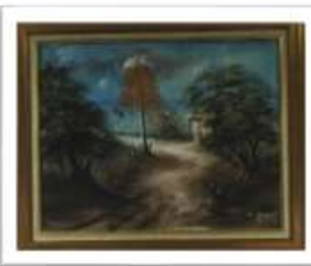
OBR-00036 AUTOR: RAMÓN ROSARIO RD$2,500.00