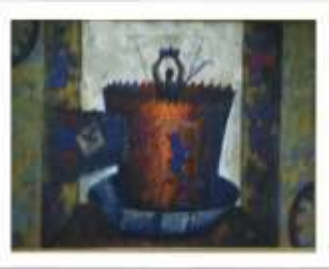
OBR-000147 AUTOR: BERNARDO THEN RD$30,000.00