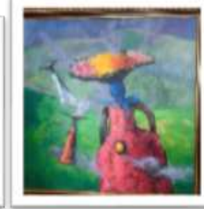
OBR-000133 AUTOR: CHIQUI MENDOZA RD$318,000.00