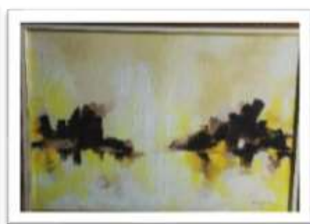
OBR-000014 AUTOR: CAROLINA CEPEDA RD$26,746.00