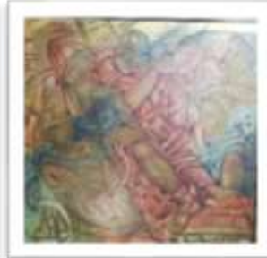
OBR-000153 AUTOR: ANTONIO GUADALUPE RD$440,000.00