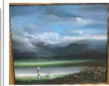
OBR-000180 AUTOR: ALBERTO HOUELLEMONT RD$50,000.00