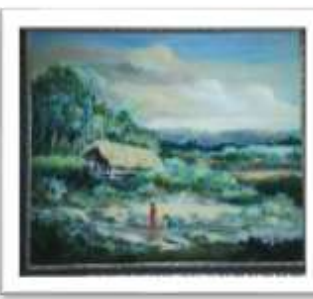
OBR-00077 LAMINA RETOCADA RD$12,500.00