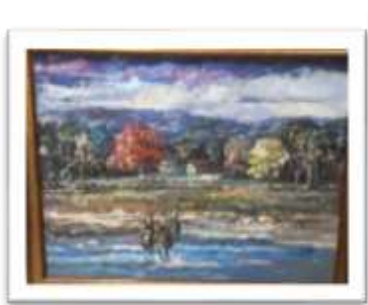
OBR-000128 AUTOR: VICTOR CHEVALIER RD$15,000.00