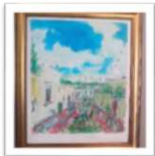
OBR-000009 AUTOR: JUAN CESTERO RD$22,500.00