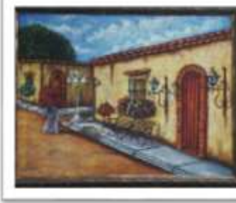
OBR-000219 AUTOR: LUIS A. QUIÑONEZ RD$5,500.00