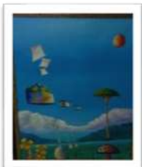
OBR-000214 AUTOR: LEO GUTIÉRREZ RD$10,000.00