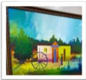
OBR-00020 AUTOR: MIGUEL DOMINGUEZ RD$18,000.00