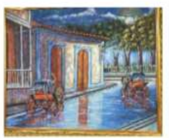
OBR-000177 AUTOR: RAFAEL GARCÍA RD$10,000.00