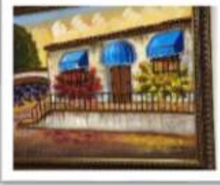
OBR-000170 AUTOR: LEODIN RD$3,000.00