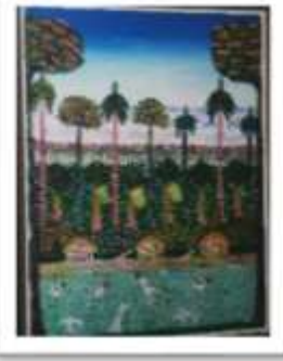
OBR-00085 AUTOR: JULIO SUSANA RD$75,000.00