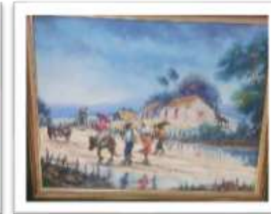
OBR-000211 AUTOR: JUAN RODRÍGUEZ RD$50,000.00