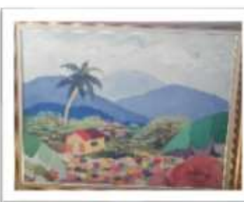
OBR-00045 AUTOR: CLAUDIO PACHECO RD$16,000.00