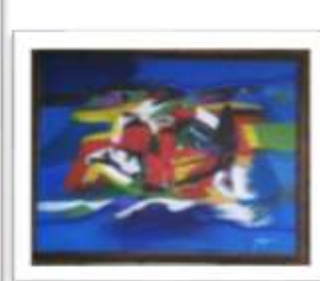
OBR-000140 AUTOR: PABLO PALASSO RD$25,000.00