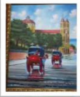
OBR-000060 AUTOR: FREDDY JAVIER RD$15,000.00