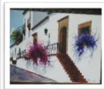
OBR-002282 AUTOR: LUIS OVIEDO RD$20,000.00