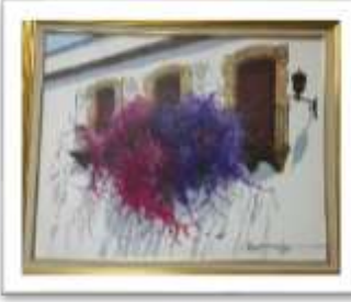
OBR-000052 AUTOR: LUIS OVIEDO RD$30,000.00