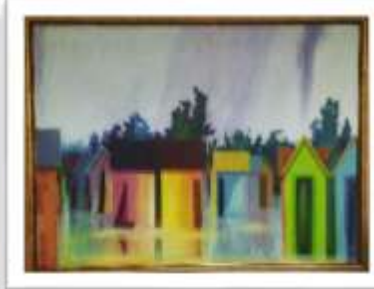
OBR-00046 AUTOR: MIGUEL DOMINGUEZ RD$10,000.00