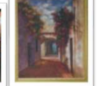
OBR-008121 AUTOR: BOLIVAR QUIÑONES RD$14,500.00