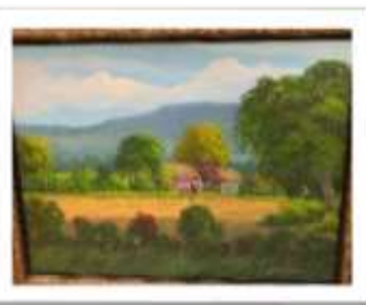
OBR-00021 AUTOR: EDUARDO RODRIGUEZ RD$15,000.00