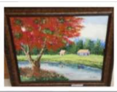
OBR-000003 AUTOR: TONY PÉREZ RD$5,000.00