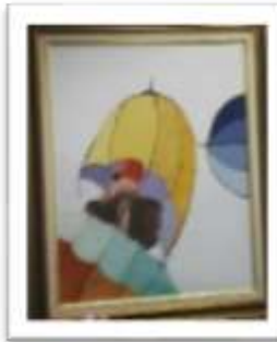
OBR-000022 AUTOR: CLAUDIO P. RD$10,000.00