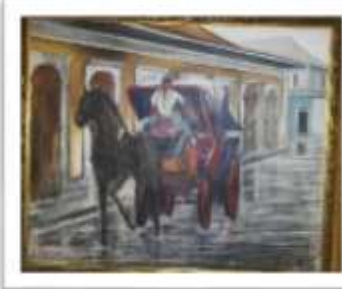
OBR-00047 AUTOR: CARLOS M. GRULLÓN RD$20,000.00