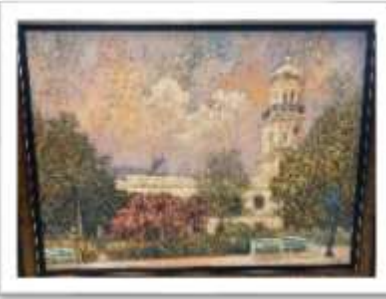
OBR-00075 AUTOR: WILLIAM POUERIET RD$20,000.00