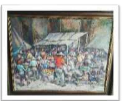
OBR-000064 AUTOR: NEY CRUZ RD$47,500.00