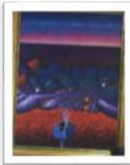
OBR-000061 AUTOR: DIONISIO BLANCO RD$40,000.00