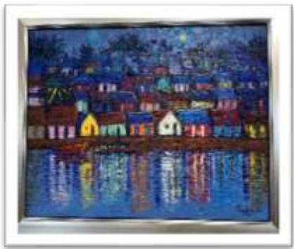
OBR-000103 AUTOR: RAFAEL AYBAR RD$10,000.00