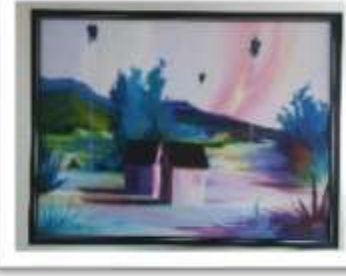
OBR-000055 AUTOR: MIGUEL DOMINGUEZ RD$18,000.00