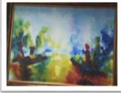
OBR-00076 AUTOR: CAROLINA CEPEDA RD$27,000.00